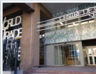
Entrée Visiteurs : Vous devez impérativement vous présenter à l'accueil où un badge d'accès vous sera remis en échange d'une pièce d'identité