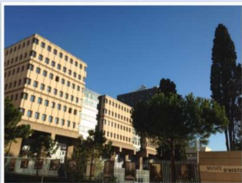
Vue d'ensemble de nos locaux 2 rue Henri Barbusse 13001 Marseille

NOVACHIM, organisme de formation, est basé dans les locaux de NOVACHIM dans un immeuble baptisé Immeuble CMCI, situé au 2, rue Henri Barbusse - 13241 MARSEILLE CEDEX 01 au 2ème étage. L'accès se fait par l'Ascenseur A.